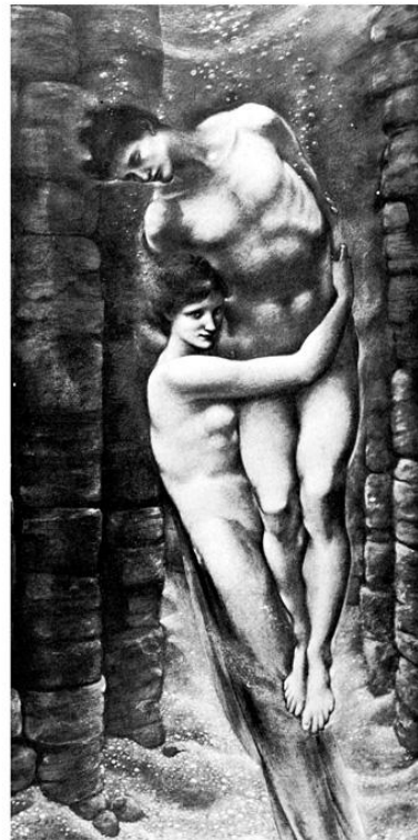
VILIJAM MORIS : UTOPIJA I ROMANSA