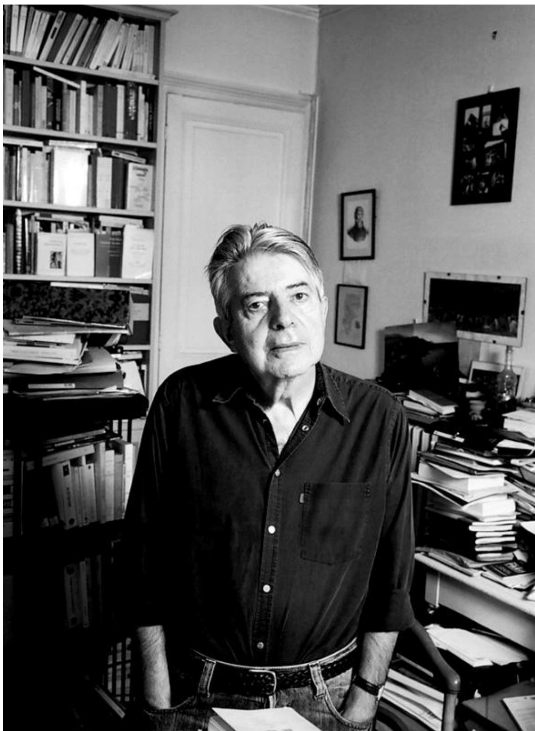
Miguel Abensour (1939–2017)