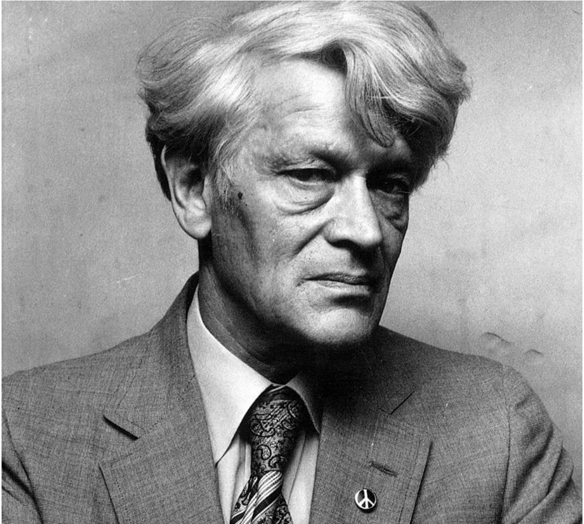
Edward Palmer Thompson (1924–1993)