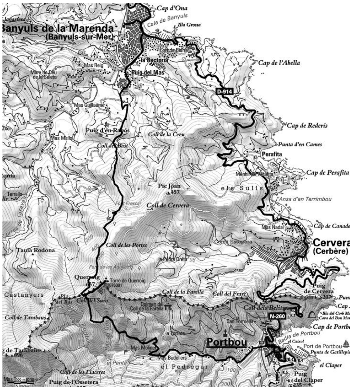
„Ruta/ Chemin Walter Benjamin“: na mapi, linija u dubini kopna.