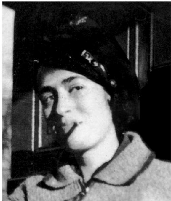
Poslednja fotografija Valtera Benjamina, 1940. Liza Fitko, Berlin, 1928.