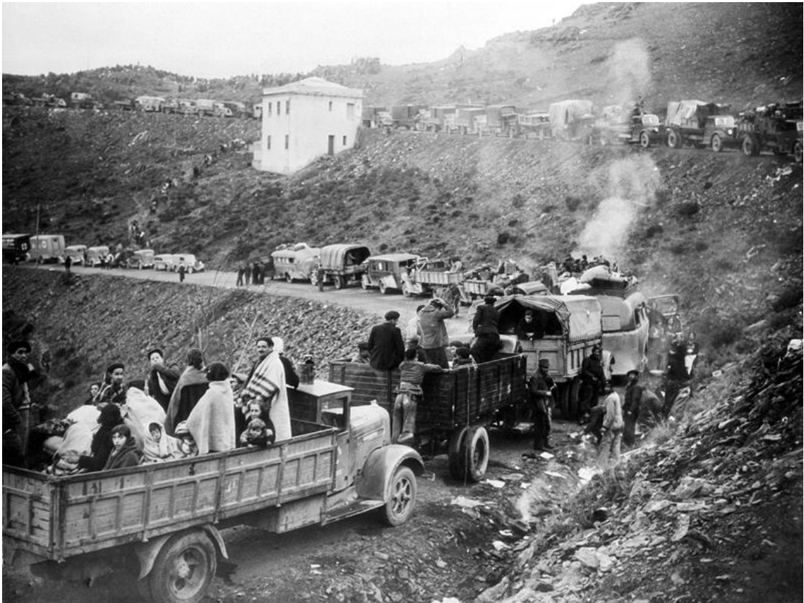
Portbou 1936. i 1939.