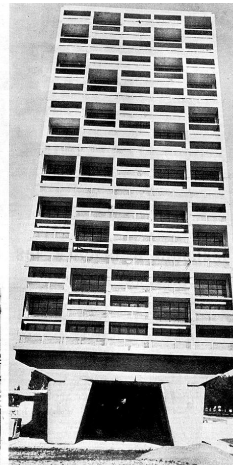
Chaque appartement a sa terrasse et sa baie vitrée de 3 m. 60 sur 4 m. 80. L'ossature est en béton, mais des cassions isolants insonorisent les cloisons. Les lojats comprennent : salle commune avec petite cuisine et, à l'étage au-dessus, chambres et salles de bains. Les 55.000 tonnes de la cité reposent sur 34 piliers de ciment.

„Maketa neke Le Korbizjeove zgrade jedina je slika koja u meni budi želju da se istog časa ubijem. S njim bi isto moglo da zadesi i poslednje ostatke radosti. Kao i ljubavi – strasti – slobode.“ Ivan Ščeglov, Pravila novog urbanizma , 1953 (1958).