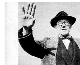
LE CORBUSIER. IL A CONSTRUIT LA MAISON DE L'AN 2000.