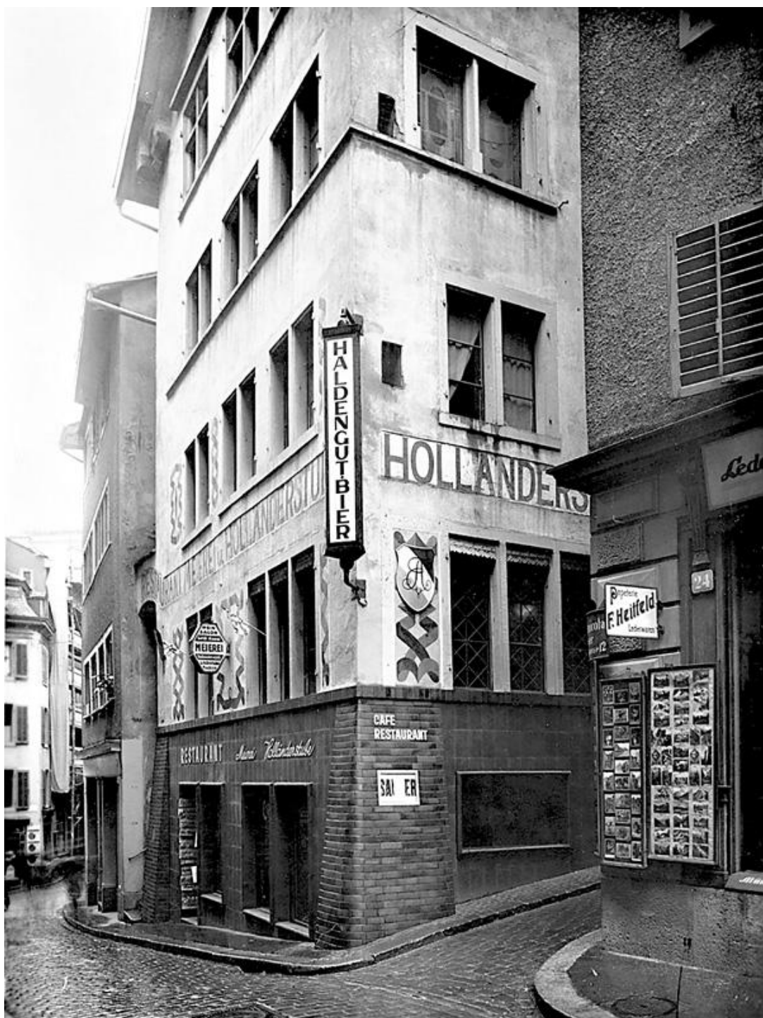
Spiegelgasse 1, adresa Cabaret Voltaire , u prizemlju nekadašnje „Holländische Meierei“ („Holandske mlekarne“, zapravo pivnice).