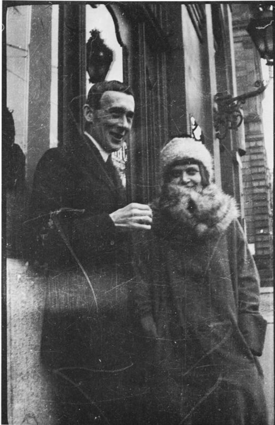
Hugo Ball i Emmy Hennings, Minhen, 1915.