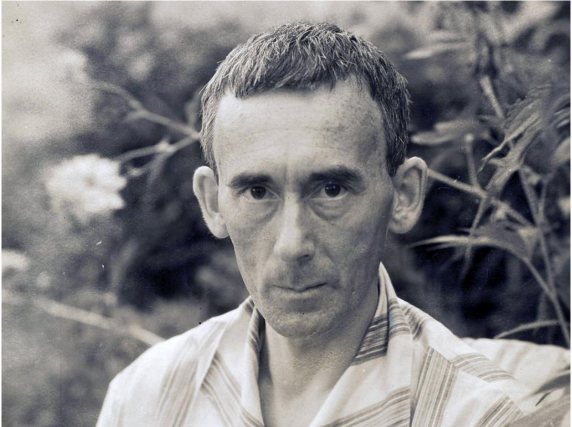
Hugo Ball, Sant'Abbondio, Švajcarska, 1927.