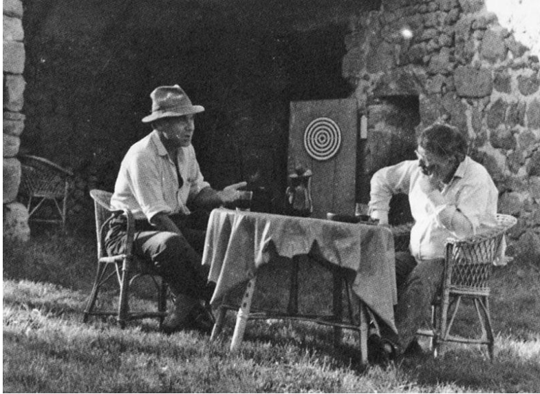
Lebovisi i Debor, Šampo (Champot), 1983.