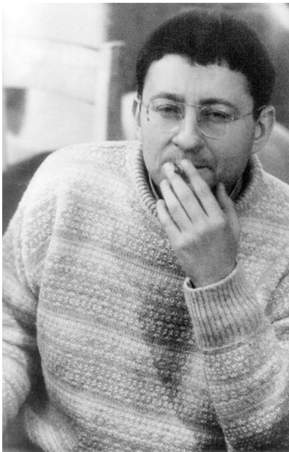
Guy Debord, 1965.