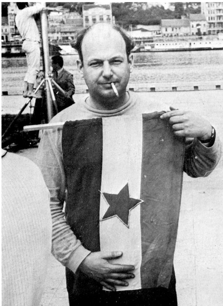
Na snimanju filma Nevinost bez zaštite , Novi Beograd (Savski kej, kod Ušća), 1968.

ma, upornošću i nepoštenjima, raskaljani putevi, magle i upletenost patrijarhalnog čoveka u sredinu kao u najnerazmrsiviju kućinu), Lukić se koristi lomovima u vertikali u kojima smo se rodili da, razvezan i oslobođen, pronađe puteve oslonca u horizontalnim determinantama .