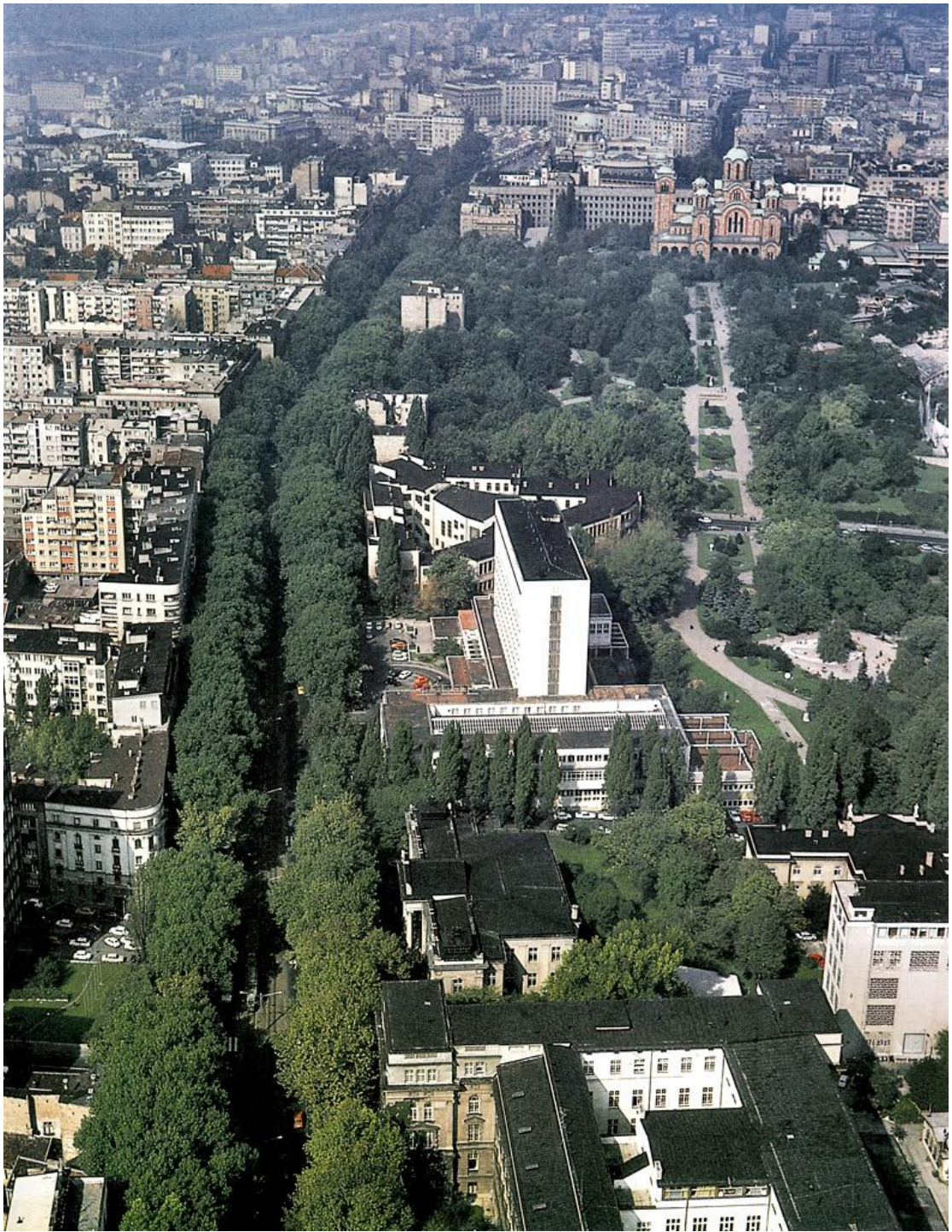
Bulevar, oko 1985. Beogradski Amazon, uništen 2010; nešto kasnije, 2011, uništen je i Tašmajdanski park (Đilas, Tadić & DS Ltd). S promenom režima, ulica prolazi kroz dalju devastaciju, na razne načine.