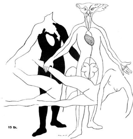
Max Ernst, ilustracija za prvo izdanje Bretonovog eseja Spojeni sudovi , Editions des Cahiers Libres, Paris, 1932.