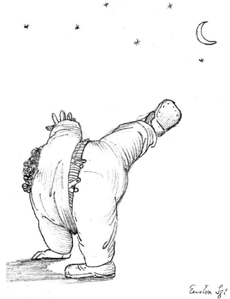
Vilijam Moris pravi zvezdu na Juston Skveru u Londonu; crtež, Edward Burne-Jones, oko 1871.

Ne znam da li je za to potrebna neka stručna potvrda, ali iskustveno se redovno pokazuje sledeće: kada zbog ilustracije za neku knjigu ili buklet, do kasno noću, uporno prelistavam beskrajne arhive slika , pošto sam prethodno po folderima tražio neku za koju mislim da je imam i da bi bila savršena, ali koju nikako ne mogu da nađem, kada se sve, dakle, svede na besomučno izlaganje nasumičnom i nepreglednom vizuelnom sadržaju, to za ishod skoro uvek